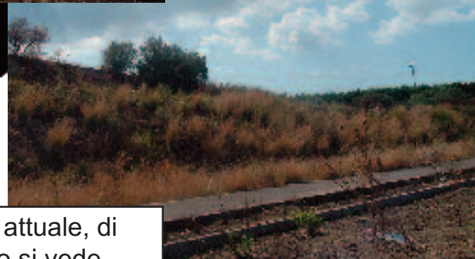
Allo stato attuale, di ortopedico si vede solo il rischio di rompersi una gamba avventurandosi nel fantomatico sito dell'ospedale..