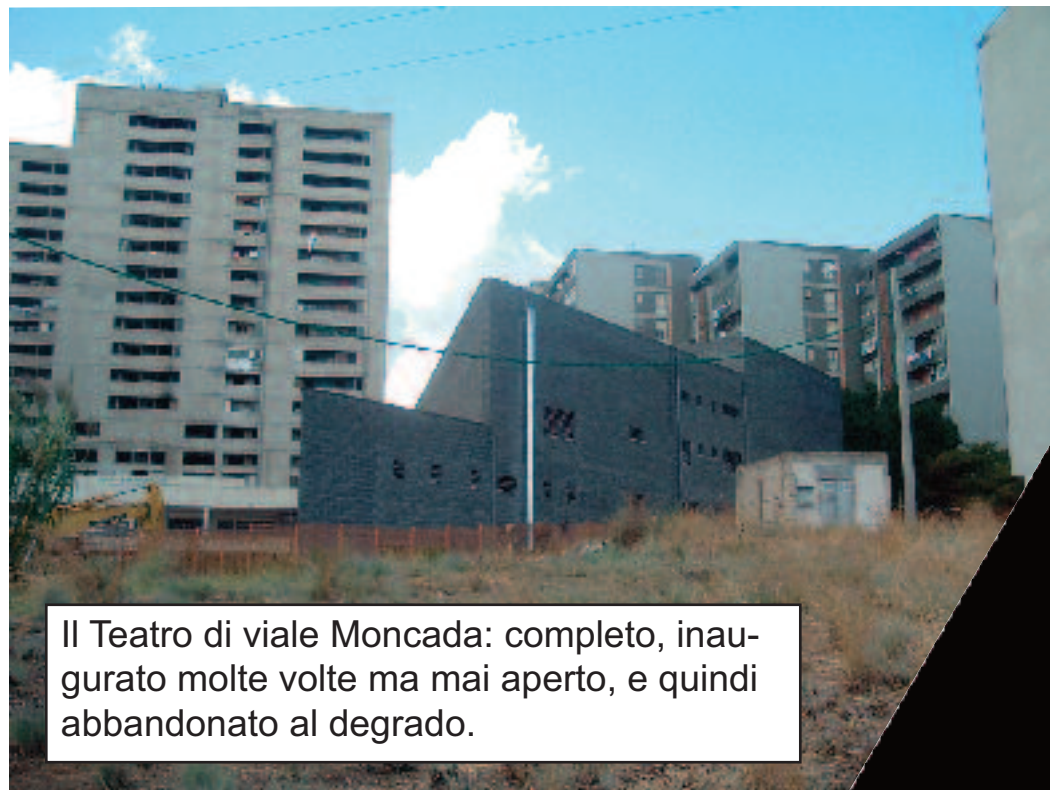
Il Teatro di viale Moncada: completo, inaugurato molte volte ma mai aperto, e quindi abbandonato al degrado.

Ogni tanto capita che le periferiche non si connettano al primo tentativo, e per riuscire a farle funzionare si deve provare e riprovare. La Periferica ha rilevato a Librino tanti errori di connessione: opere pubbliche promesse e mai realizzate, in corso di realizzazione da anni, oppure realizzate e lasciate all'abbandono. Ecco un primo elenco degli errori riscontrati (in attesa di riparare i guasti).