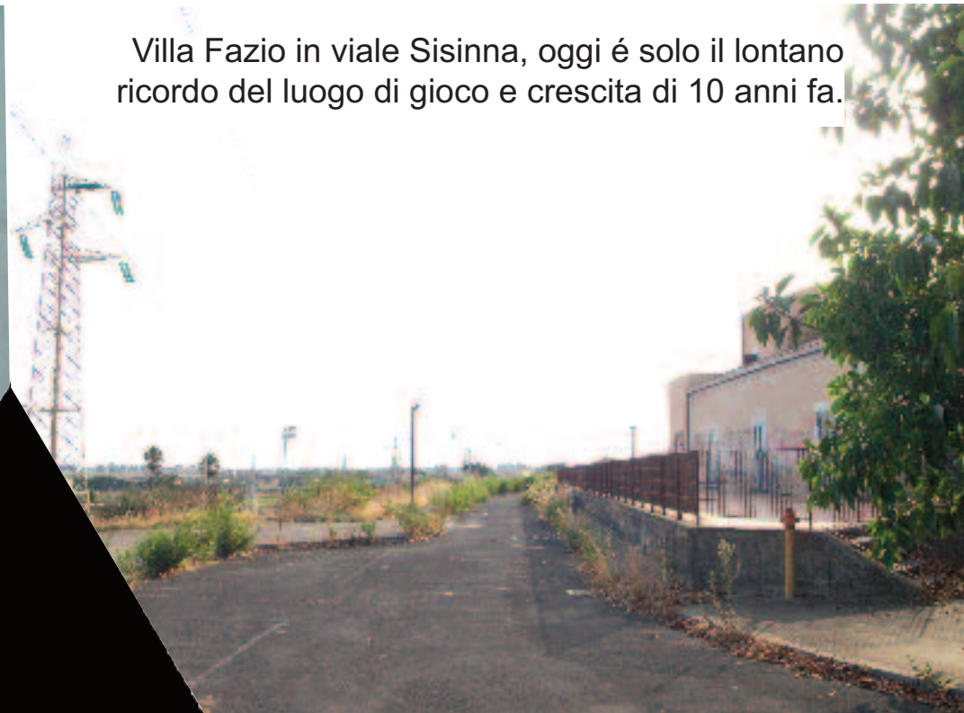
Villa Fazio in viale Sisinna, oggi è solo il lontano ricordo del luogo di gioco e crescita di 10 anni fa.