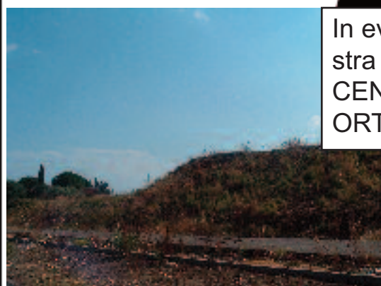
In evidenza nelle foto a sinistra e in basso, il CENTRO DI ECCELLENZA ORTOPEDICO.