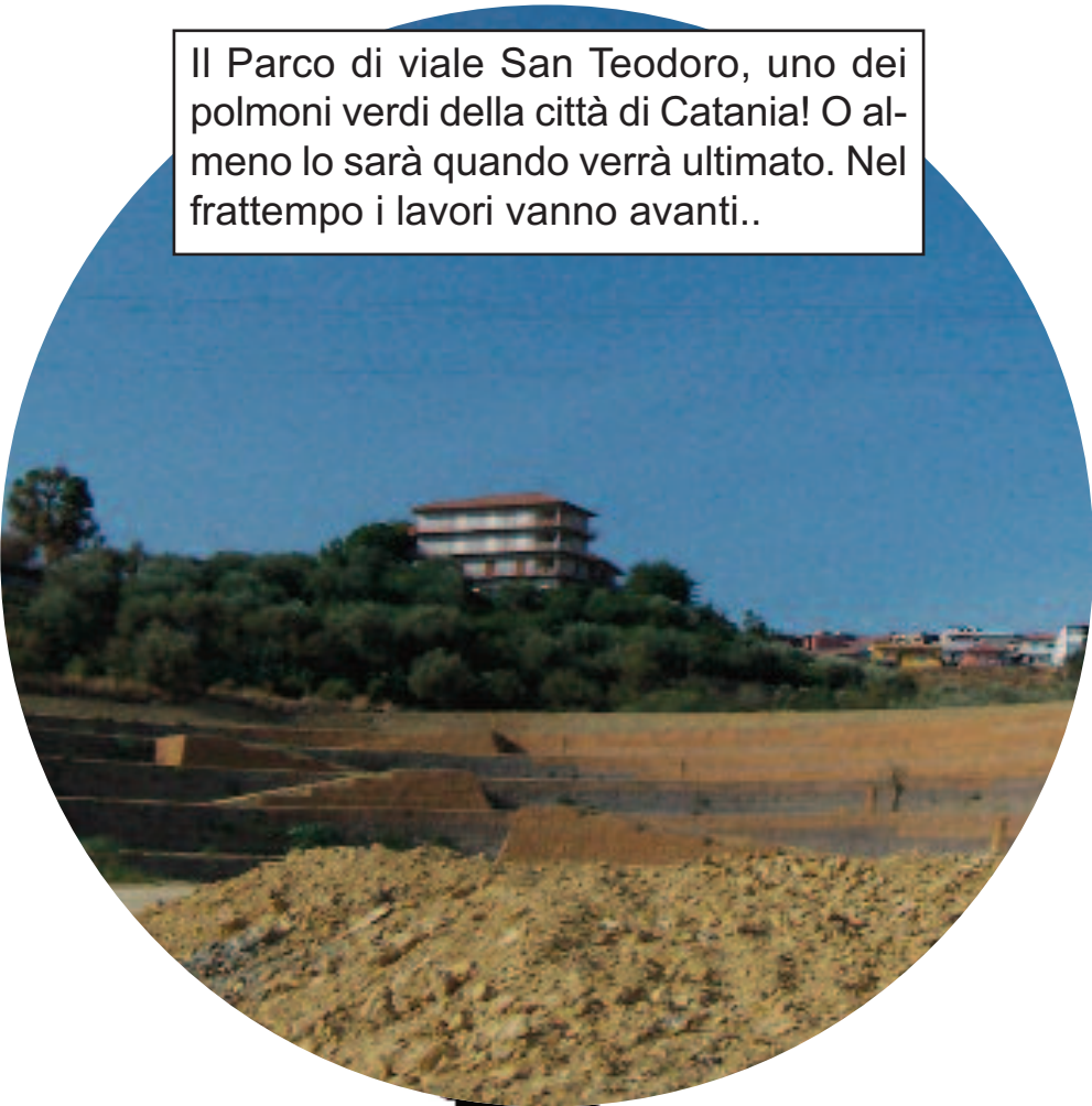
Il Parco di viale San Teodoro, uno dei polmoni verdi della città di Catania! O almeno lo sarà quando verrà ultimato. Nel frattempo i lavori vanno avanti..